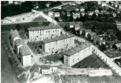
Stockage de la force de travail

1945 Maurice Thorez, qui clame « retroussez les manches ! », élude la question de quoi reconstruire.